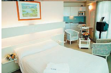
Dax Thermal 2**