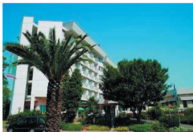
Hôtel Ibis Miradour 2**