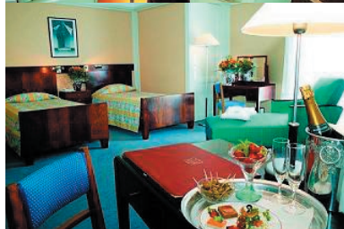
Mercure Splendid 3***