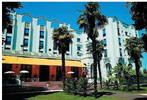
Mercure Splendid 3***

Débordante de plaisirs, Dax sait vibrer au rythme des traditions de son histoire : féria, pelote Basque, rugby, bandas, fêtes populaires, folklore Landais... Tout au long de l'année elle vous fera vivre un programme de festivités haut en couleurs.