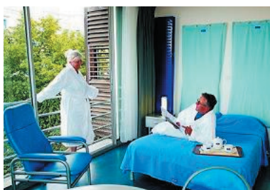
Résidence de tourisme Les Thermes